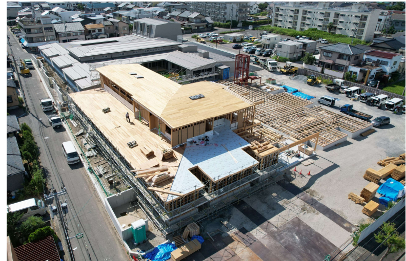
建築状況写真 (R5.7.27撮影)